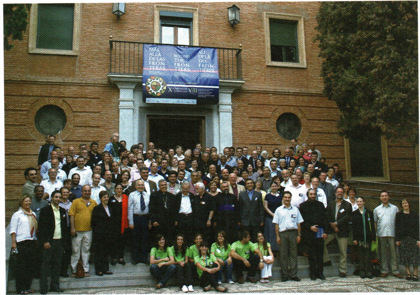
Ponentes, asistentes, voluntarios y organizadores, en la entrada del Seminario

¿Qué supone en un país árabe la conversión al cristianismo? Para todos los países musulmanes la conversión de un musulmán al cristianismo está totalmente prohibida por ley. Incluso, en los países más radicales, como Arabia Saudí, Pakistán, Irán o Afganistán está prohibida, y con pena de muerte. Si no hay pena de muerte, hay encarcelamiento, multa, y si no, la propia familia te mata.