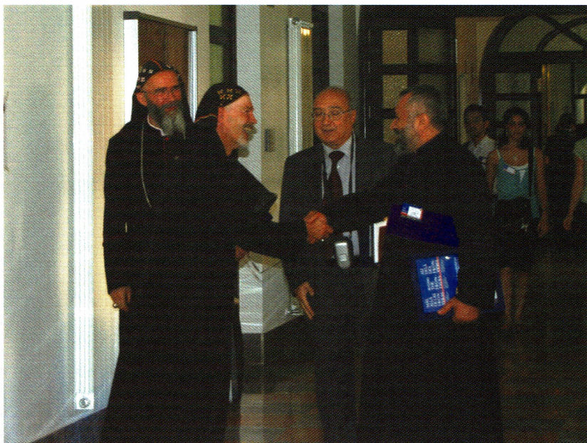
Los participantes en el Simposio proceden de todo el mundo

traste que hay entre la monumentalidad de los edificios que evoca la fe de antaño, y sin embargo el vacío de gente indica la ausencia de fe de hoy. Y a ellos les choca mucho ese contraste tan grande.